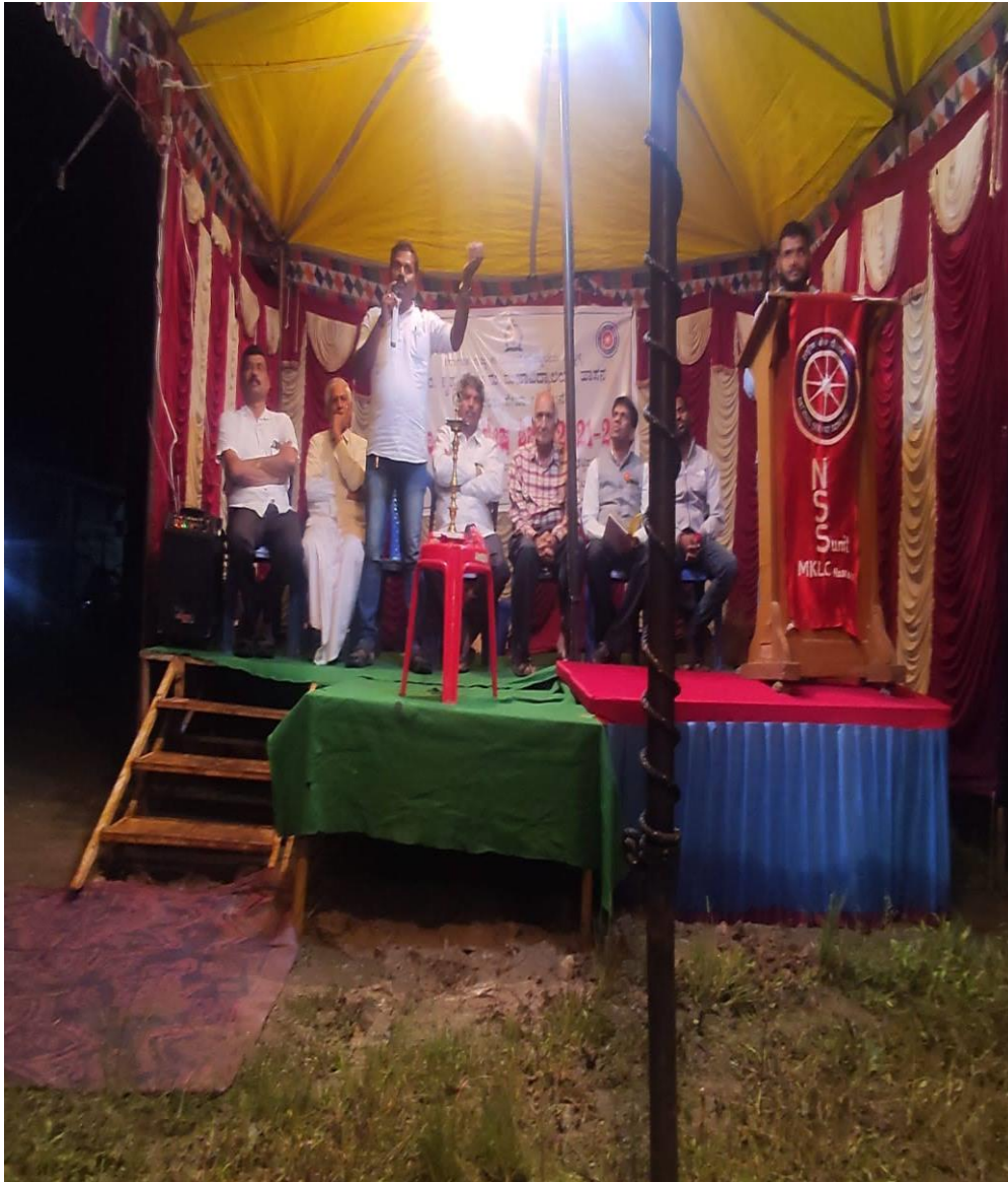
Special Lecture organised on Land Records and Law on 0/8/2022 at Shettihalli village