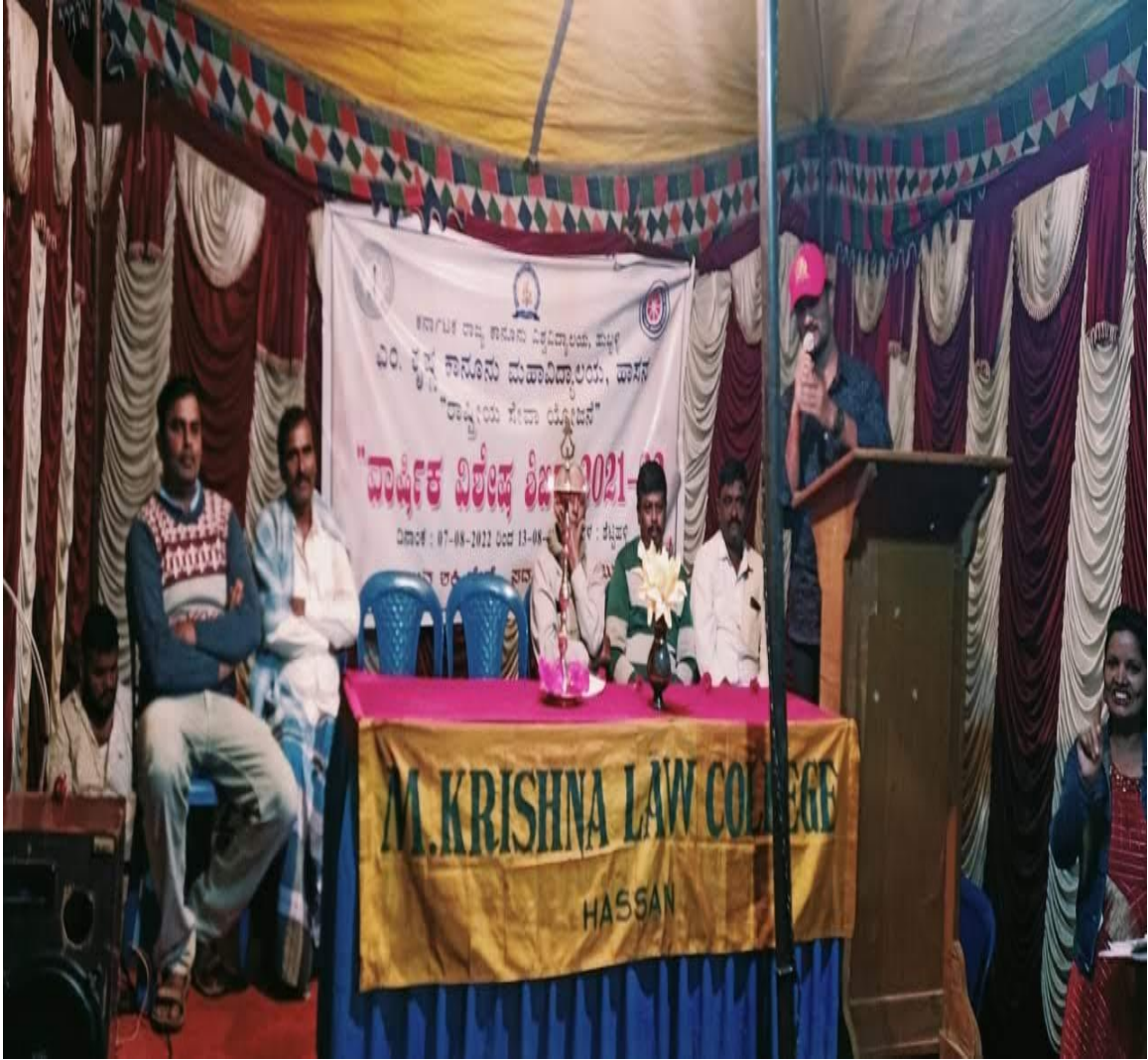
Special Lecture on “Life Skills” on 09/08/2022 at Shettihalli Village, Shettihalli Gramapanchayat, Hassan.