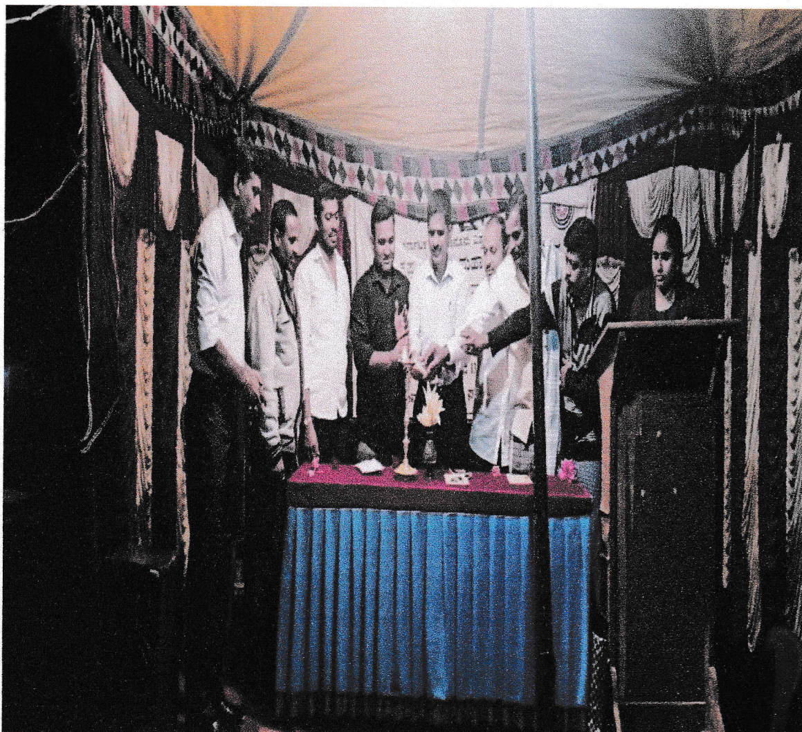
Special Lecture on Mental Health and Personality Development on 11/08/2022